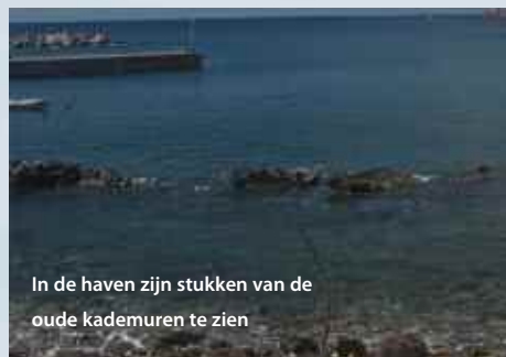
In de haven zijn stukken van de oude kademuren te zien

Op sommige plaatsen is het wrak van de Charlie Brown – minder dan tien jaar geleden pas afgezonken – al prachtig begroeid en het is een genot om daar foto's te maken. Er zelfs nog een tweede duik op gemaakt. Er naar toe in een kleine Zodiac. Best wel eng. Doordat er die dag met nitrox werd gedoken was er de mogelijkheid om