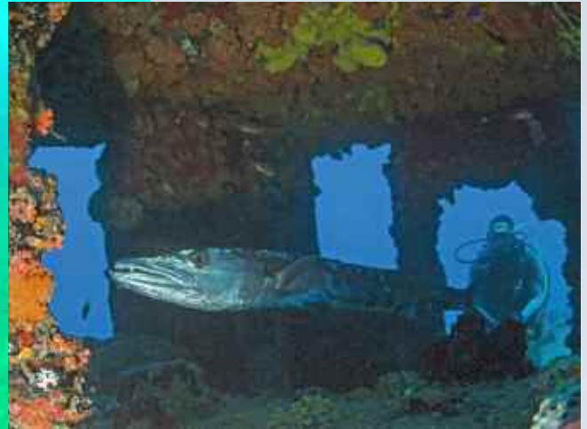
Het sleepbootje bij Statia steekt dat van Curaçao naar de kroon en heeft een barracuda als vaste bewoner