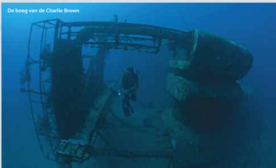
De boeg van de Charlie Brown

Duiken dus. Eigenlijk al jaren van plan geweest. Veel gehoord ook over het eiland, maar nooit van gekomen. Er liggen beroemde wrakken zoals de kabellegger van AT&T de Charles L. Brown. Een bijzonder wrak ook voor een oud-medewerkster van dat bedrijf, die ook nog eens als oud HAL-bemanningslid, Holland Amerika Lijn, gek is op schepen.