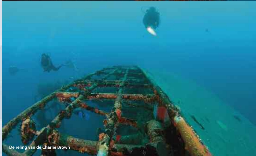
De reling van de Charlie Brown

centrum heeft zich jarenlang voor dit project ingezet. In zijn duikschool hangt nog de originele presentielijst van de boot.