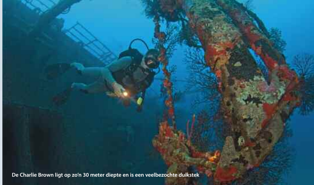
De Charlie Brown ligt op zo'n 30 meter diepte en is een veelbezochte duikstek